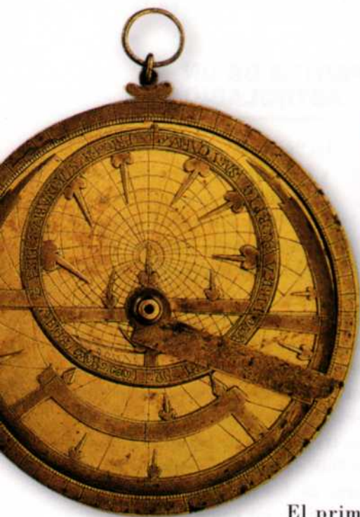
fig. 6 Astrolabio denominado "carolingio" o de Ripoll (c. 1000). Institut du Monde Arabe de París

El primero de los grandes científicos hispano-árabes que además fue profundo conocedor del astrolabio fue Maslama al-Mayriti (?-1007) quien tuvo en Córdoba unos discípulos excepcionales que contribuyeron extensamente a la divulgación de dicho instrumento. Entre ellos cabe destacar Ahmad Ibn al-Saffar (?-1034), autor en Denia de un tratado del astrolabio ampliamente difundido y traducido al latín en Ripoll y su hermano Muhammad Ibn al-Saffar quien fue autor de varios astrolabios, entre ellos los conservados en Edimburgo (1026) y en Marburg (1029).