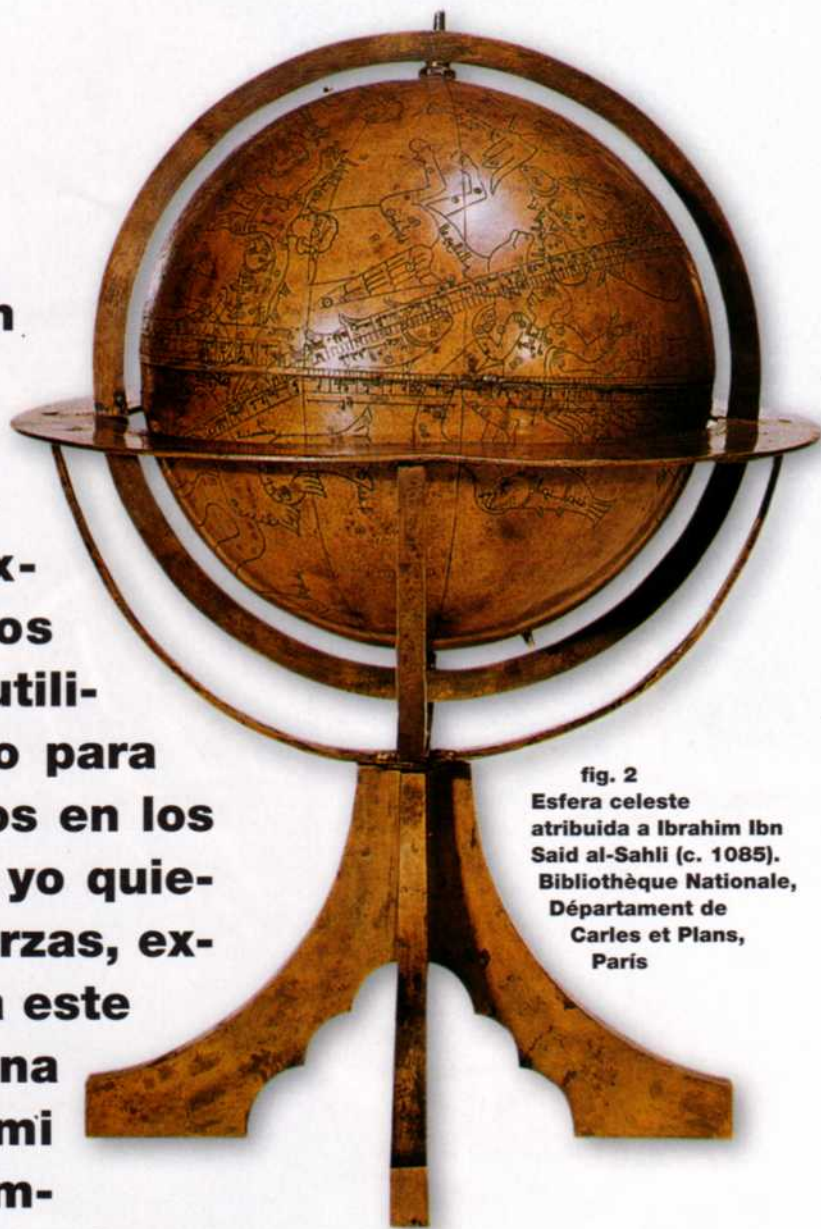
fig. 2 Esfera celeste atribuida a Ibrahim Ibn Said al-Sahli (c. 1085). Bibliothèque Nationale, Département de Cartes et Plans, Paris

Juan Filópono de Alejandría, el Gramático (s. VI)