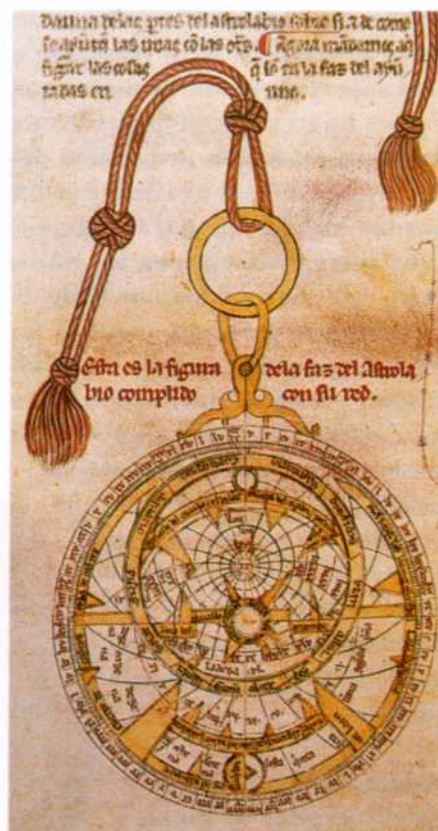
fig. 7 Dibujo del astrolabio planisférico de los Libros del Saber de Astronomía (fol. 75v). Biblioteca de la Universidad Complutense de Madrid.

Para proyectar las esferas sobre el plano, en el astrolabio se utiliza un tipo de proyección llamada estereográfica que se cree que fue conocida ya en tiempos de Hiparco (s. II a.C.). Posteriormente Vitrubio (s. I a.C.) ya describe un reloj anafórico en el que el mapa