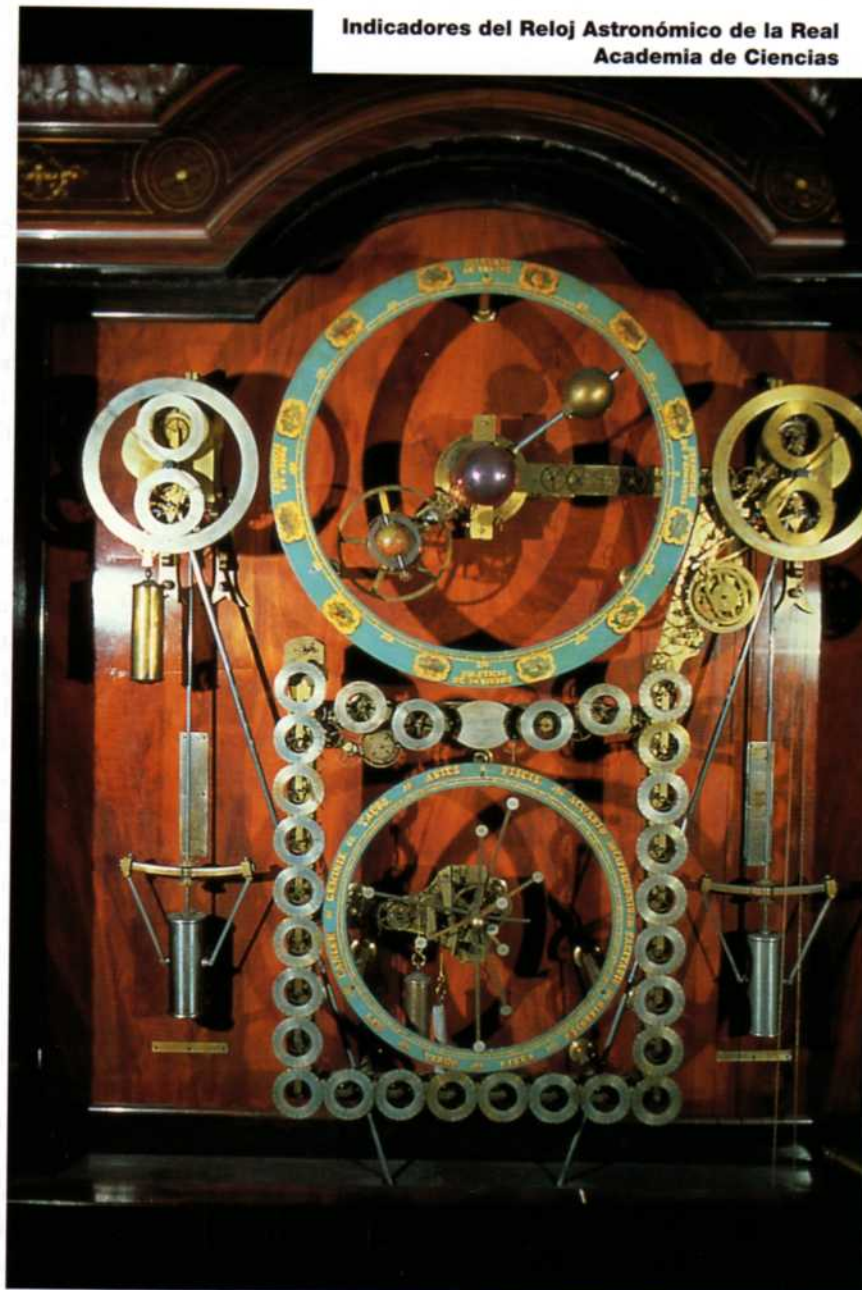
Indicadores del Reloj Astronómico de la Real Academia de Ciencias

Naciones y se atreve a esperar que no en vano acudirá a la benevolencia, a la ilustración y al amor a las artes Españolas que alientan a los dignos representantes de la Nación. Madrid a 21 de enero de 1858".