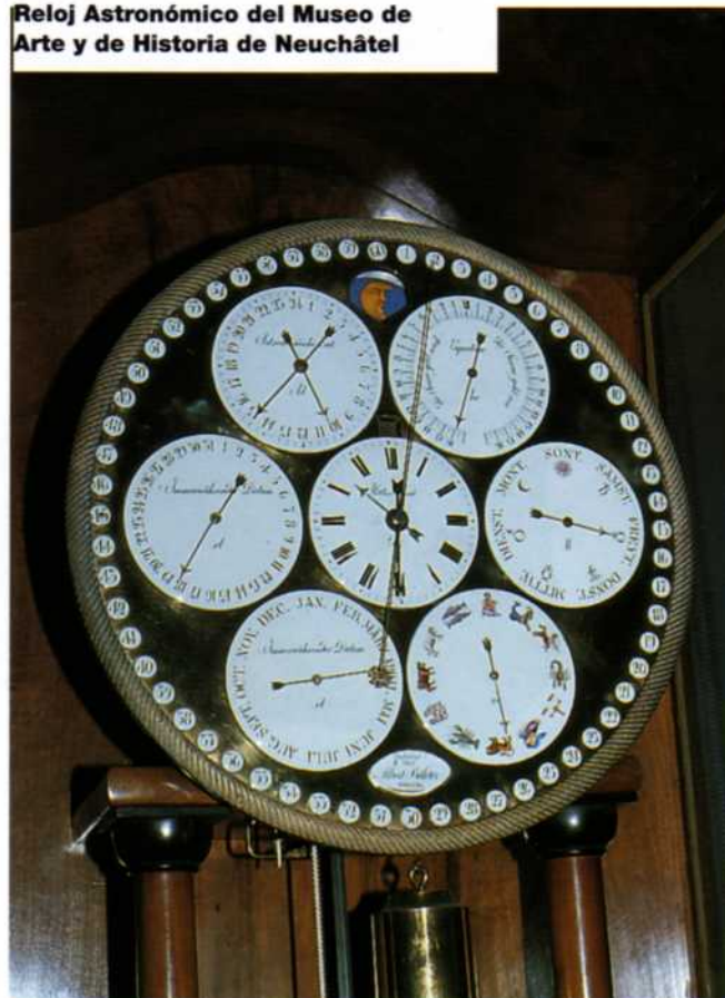
Reloj Astronómico del Museo de Arte y de Historia de Neuchâtel

A pesar de la juventud de su autor el reloj de Neuchâtel deja patentes las cualidades creadoras de Billeter: un elegante mueble de sobrias líneas de 215 cm de altura por 59 de anchura y 36 de profundidad alberga un reloj de siete esferas que, a través de un complejo mecanismo, indica diversos datos astronómicos. Las esferas son esmaltadas y algunas policromadas i están ingeniosamente distribuidas en un disco mayor que contiene 60 pequeños discos esmaltados con la numeración de las horas.