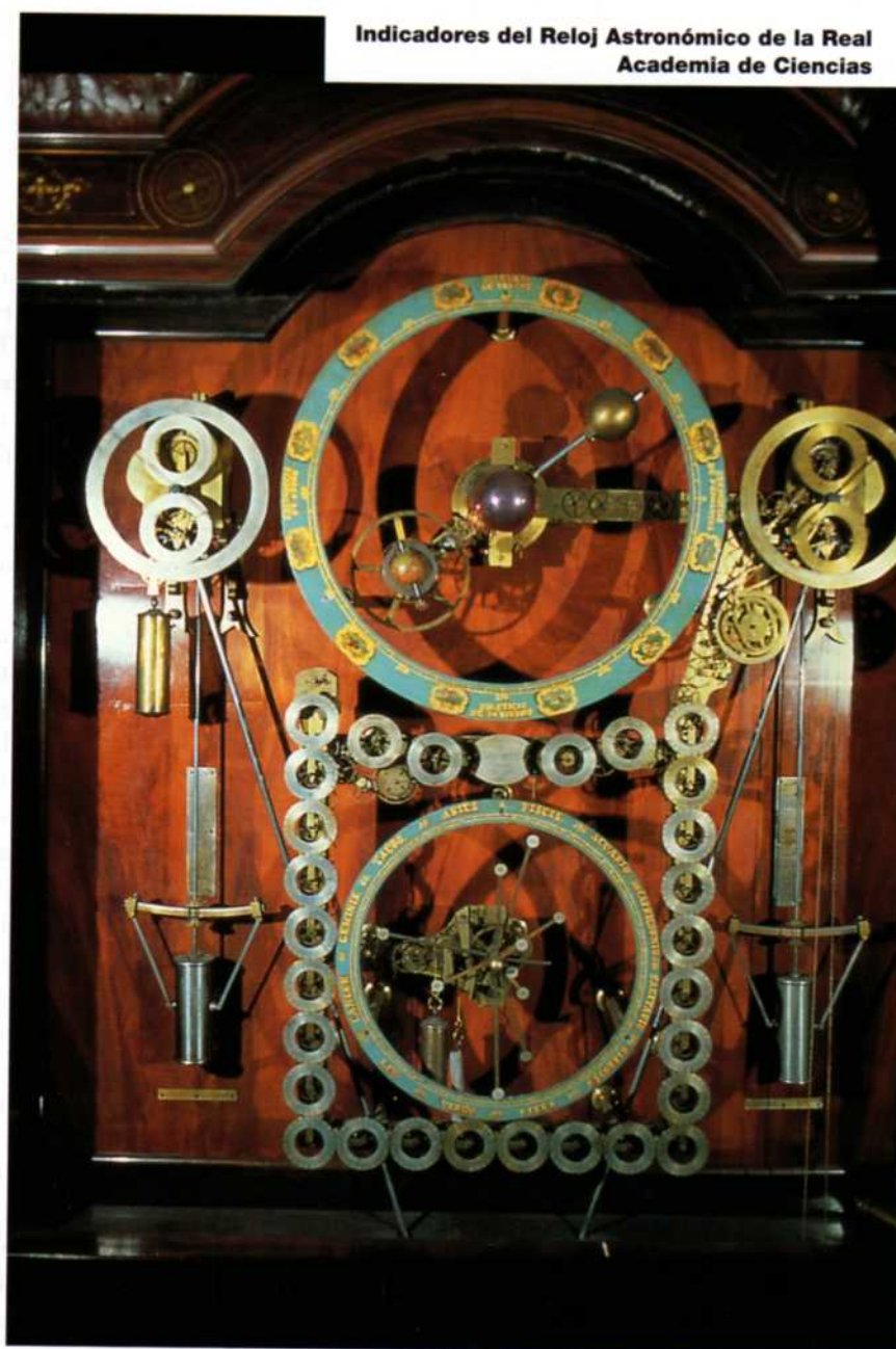
Indicadores del Reloj Astronómico de la Real Academia de Ciencias

Naciones y se atreve a esperar que no en vano acudirá a la benevolencia, a la ilustración y al amor a las artes Españolas que alientan a los dignos representantes de la Nación. Madrid a 21 de enero de 1858".