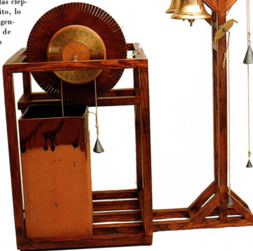
Clepsidra despertador de Ripoll