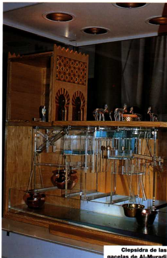
Clepsidra de las gacelas de Al-Muradi

En el reloj de mercurio se emplearon materiales y acabados fieles a la época, latón y madera, excepto en la cámara de mercurio que fue realizada en material transparente con fines didácticos.