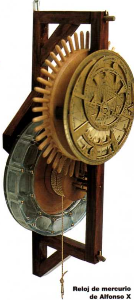
Reloj de mercurio de Alfonso X

No es la primera vez que se reproducen los relojes de Alfonso X, pero la nueva versión realizada en los talleres de D.M.T. fue hecha a partir de una nueva interpretación de los manuscritos alfonsíes conservados en la Universidad Complutense de Madrid y combinando la fidelidad al texto y a la época con el empleo de materiales modernos adecuados para el uso didáctica de los relojes.