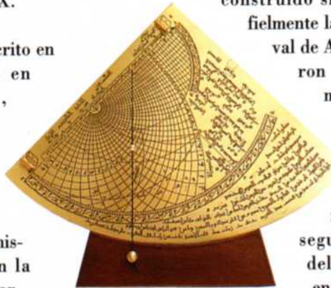
Cuadrante astronómico de Al-Shihab

fielmente la descripción medieval de Al-Muradi, se utilizaron técnicas y mecanismos contemporáneos a la época de su descripción y materiales modernos transparentes que permiten seguir las evoluciones del agua y sus efectos en el movimiento de las figuras.