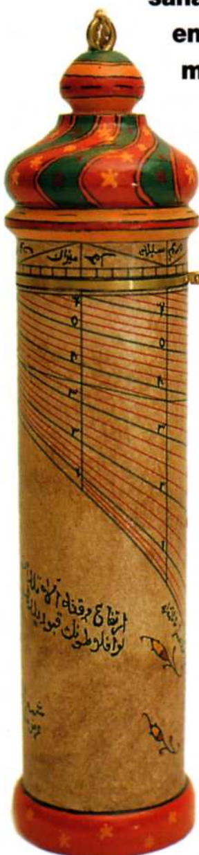
Reloj de sol otomano

C uando se trata de reproducir instrumentos que sólo existen sobre el papel, se recurre a la interpretación exhaustiva de los textos originales a cargo de equipos que se constituyen, según las necesidades, formados por expertos latinistas, arabistas, medievalistas, historiadores y relojeros. Los relojeros de D.M.T. han adquirido así una buena dosis de cultura medieval y árabe y se han especializado profundamente en la historia del reloj.