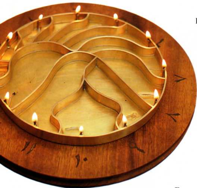
Reloj de los 12 candiles de Ibn Yunis

Al ascender el agua del recipiente, también asciende el flotador y el cuadro de las horas se hace visible al salir al exterior a través de una ranura hecha en la tapa cuyo nombre, círculo del horizonte, da la idea de que los signos zodiacales que están apareciendo por la ranura representan los que en el mismo momento están apareciendo en el cielo por el horizonte de levante, lo cual se indica en el reloj al mismo tiempo que la hora del día y de la noche.