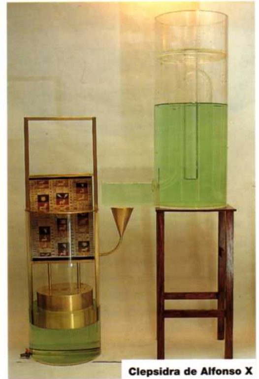
Clepsidra de Alfonso X

La máxima originalidad de esta clepsidra reside en un gran depósito de agua cerrado herméticamente que alimenta un pequeño recipiente que tiene el agujero de goteo en el fondo y cuyo nivel se ha de mantener constante para que la caída del líquido sea regular y apta para medir el tiempo.