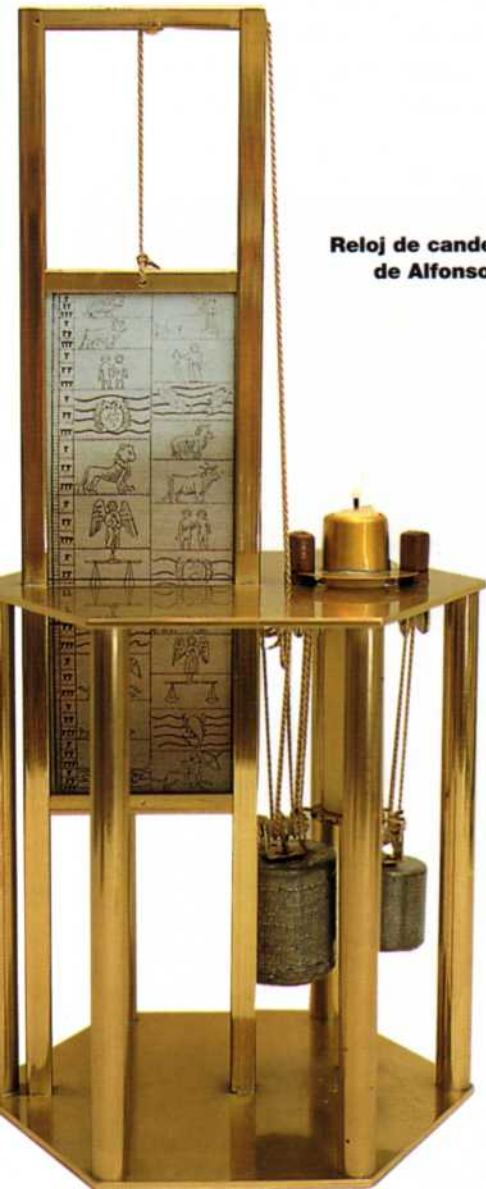
Reloj de candela de Alfonso X

De estos cinco relojes hay dos de sol, los llamados Reloj de la Piedra de la Sombra y el Reloj del Palacio de las Horas; un reloj de combustión denominado Reloj de la Candela, una clepsidra o Reloj dell Agua y el Reloj dell Argent Vivo o reloj cuyo funcionamiento, basado en el principio de las clepsidras, utilizaba mercurio en vez de agua.